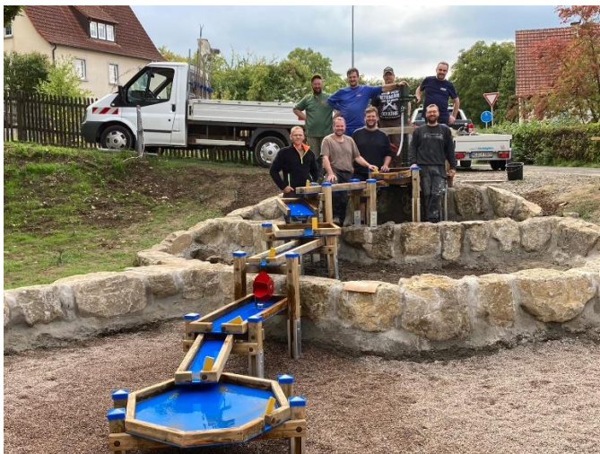
Abbildung 2 Die Ehrenamtlichen, die den Wasserspielplatz bauten, zeigen stolz das Ergebnis.

Standort: Hinter der Stadtmauer am Torbogen beim Wasserrad - Obere Pforte