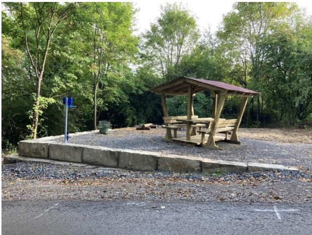
Abbildung 7 Der neue Trailhead am Flowtrail lädt zum Ausruhen nach der Abfahrt ein.