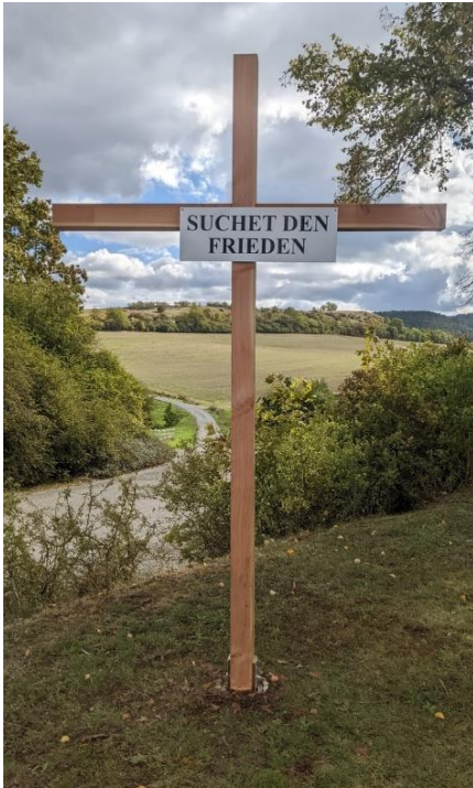
Abbildung 14 Die Kreuzverse regen zum Nachdenken auf dem Spaziergang des Kreuzweges in und um Ostheim v. d. Rhön herum an.

Standort: In und um Ostheim v. d. Rhön herum