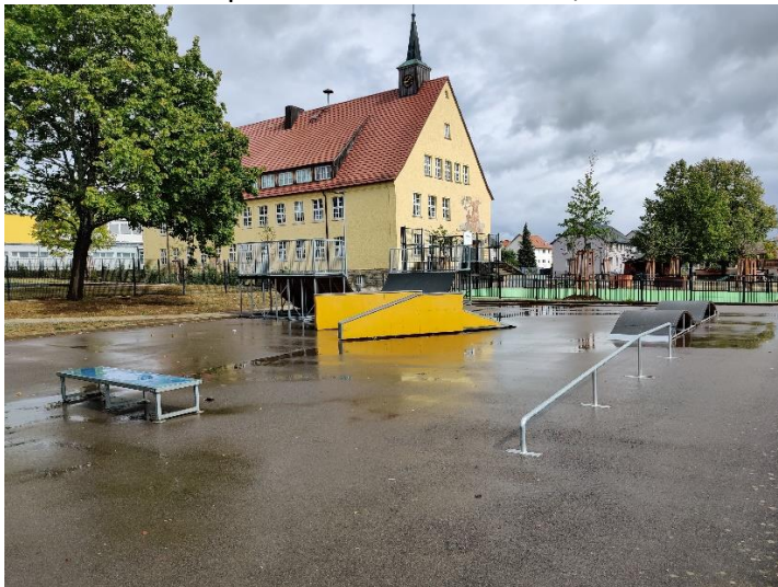
Abbildung 13 Der ostheimer Skateplatz mit vielen neuen Attraktionen.

Standort: Skateplatz Ostheim v. d. Rhön, Ritter-von-Halt-Straße