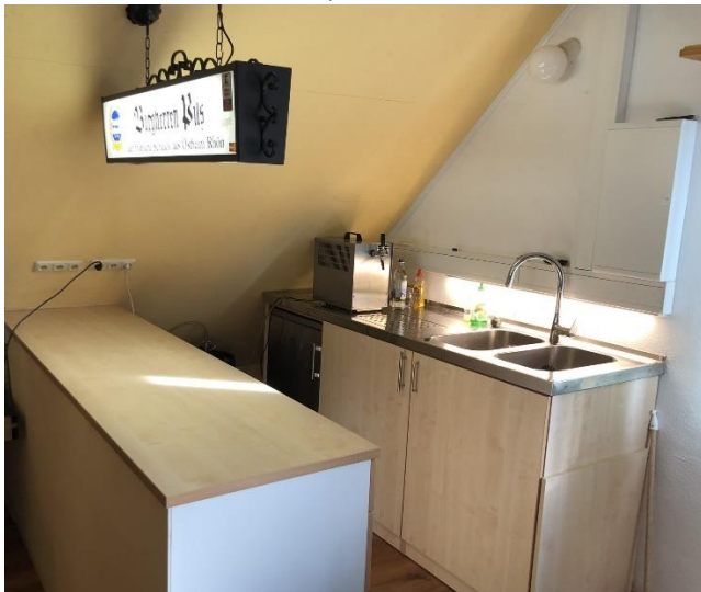
Abbildung 12 Die neue Küche des Obst- und Gartenbauvereins Oberstreu für Vereinsaktivitäten, Kurse und Vorträge.

Standort: Vereinsheim/Kelterhaus Brückenstr. 28, Oberstreu