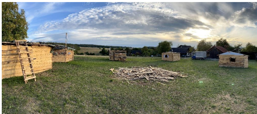
Abbildung 4 Der Abenteuerspielplatz in Hendungen war ein voller Erfolg. Die Kinder und Jugendlichen konnten ihre eigenen Häuser bauen.

Standort: Johannisfeuerplatz, Hendungen (in den Sommerferien)