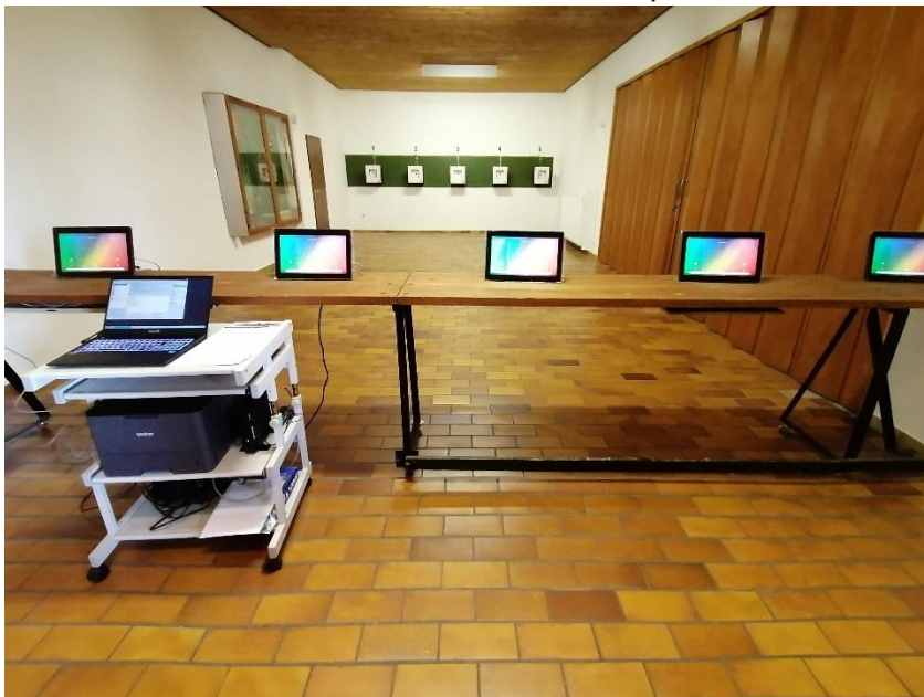
Abbildung 15 Die neue elektronische Schießanlage im Schützenverein (Foto: Reiner Hergenhan).

Standort: Schützenverein Silberdistel Stetten/Rhön e. V.