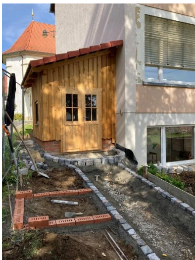
Abbildung 6 Bei der Ackerschule Hendungen wurden Beete angelegt und eine Gartenhütte für die Geräte aufgebaut.