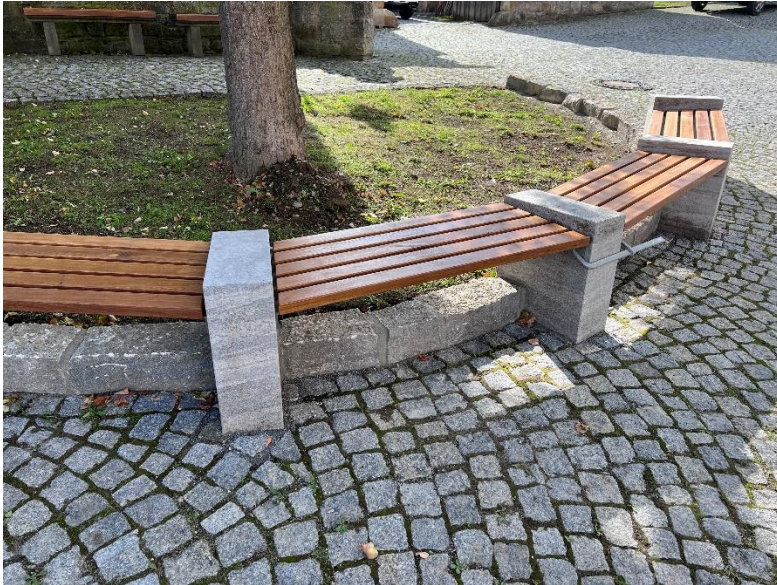
Abbildung 5 Der neue Dorfmittelpunkt lädt zum Verweilen und zum Austausch zwischen den Bürgerinnen und Bürgern ein (Foto: Gemeinde Hendungen).