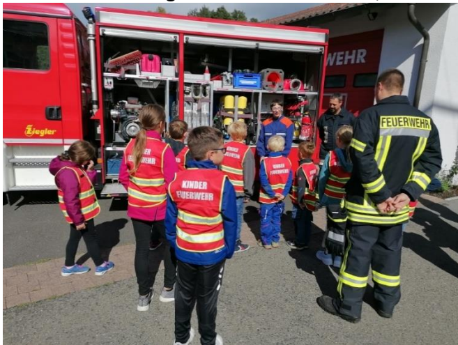
Abbildung 16 Die neu gegründete Kinderfeuerwehr ist ein voller Erfolg. Mitglieder der Jugendfeuerwehr erklären den Kindern die Ausstattung eines Feuerwehrautos.

Standort: Freiwillige Feuerwehr Willmars, Alleestr. 13