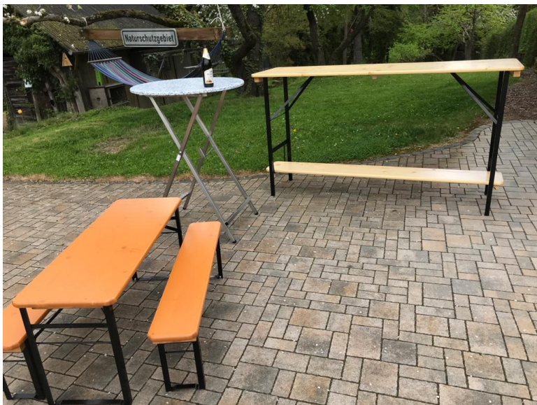
Abbildung 8 Die neue Ausrüstung für Vereinsaktivitäten der Bierranhas