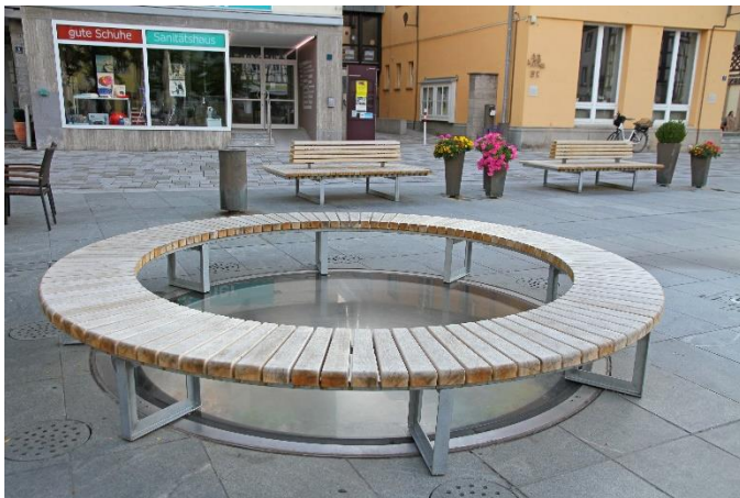
Abbildung 9 Die neuen Bänke rund um den Brunnen fügen sich gut in die Umgebung ein.