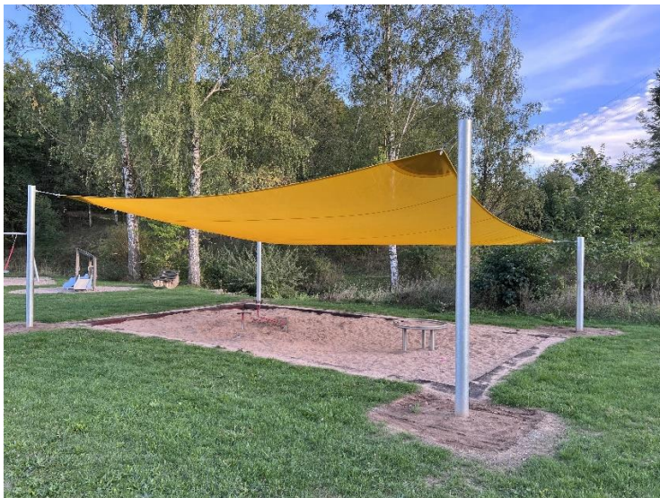
Abbildung 3 Eine der vielen neuen Attraktionen auf dem Spielplatz in Hendungen. Das Sonnensegel schützt die spielenden Kinder (Foto: Gemeinde Hendungen).

Standort: Spielplatz Hendungen, Kirmesgarten