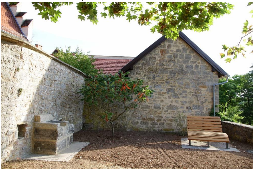
Abbildung 10 Der neugestaltete Stadtbalkon lädt zum Genießen ein.

Standort: Stadtbalkon/Innenhof VG Mellrichstadt