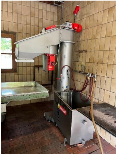
Abbildung 1 Die neue Wasch- und Mahlanlage mit Rätzmühle für die Kelterei Rödles (Foto: Tobias Seufert).

Standort: Lebenhaner Weg 10, Gemeinde Bastheim, OT Rödles