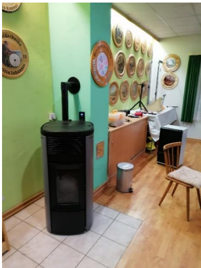
Abbildung 2 Die neuen Pelletsöfen entlasten immens das Ehrenamt im zeitlichen Aufwand. Zudem ist der Sicherheitsaspekt nun für alle gegeben und die Ressourcen werden geschont (Foto: Bernd Faulstich).

Standort: Schützenheim Stockheim, Grasberg, Stockheim