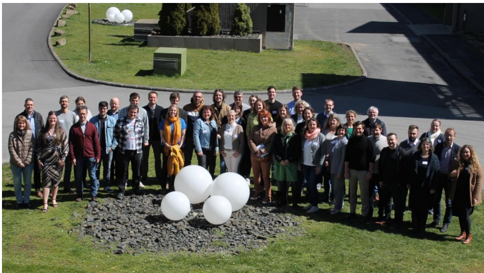
Abbildung 1: Gruppenfoto der Teilnehmer des ILE-Netzwerktreffens im Streutal

19.04.2023: ILE-Netzwerktreffen im Streutal (Rhön Park Hotel)