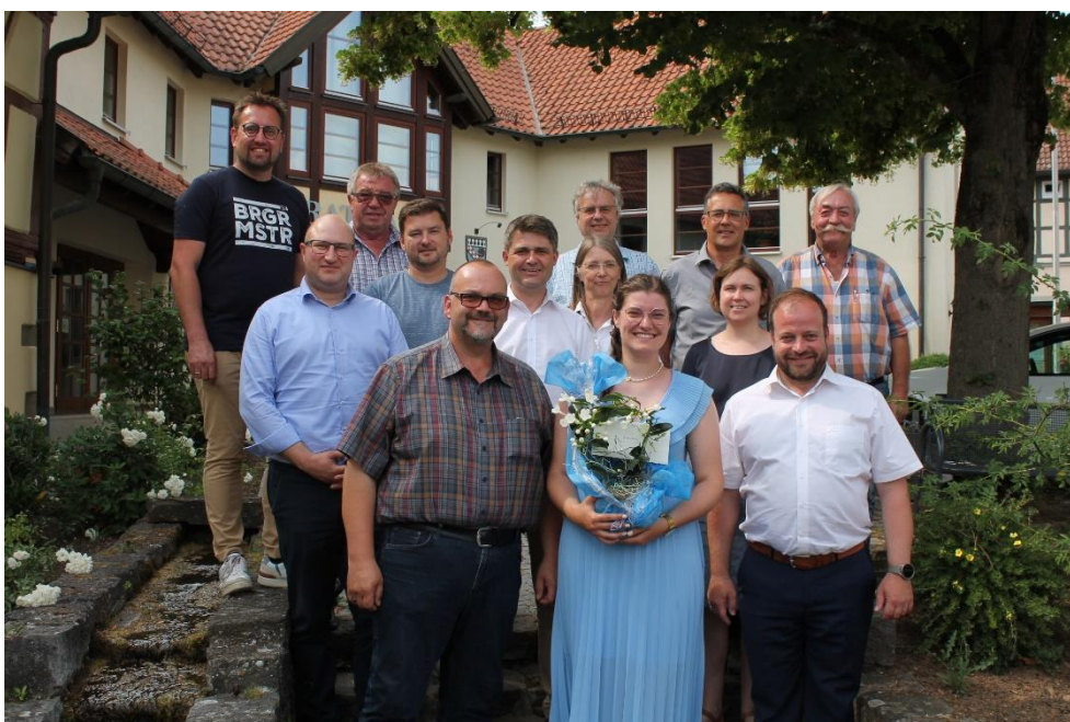
Abbildung 4: Verabschiedung von Frau Kokula