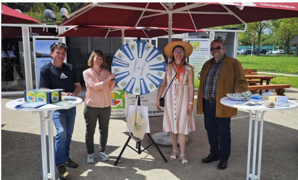
Abbildung 2: Gemeinsamer Auftritt von Streutalallianz und Allianz fränkischer Grabfeldgau auf der hessischen Landesgartenschau in Fulda

13./14.05.2023: Landesgartenschau Fulda, Werbung für Region, gemeinsame Präsenz mit Grabfeld-Allianz