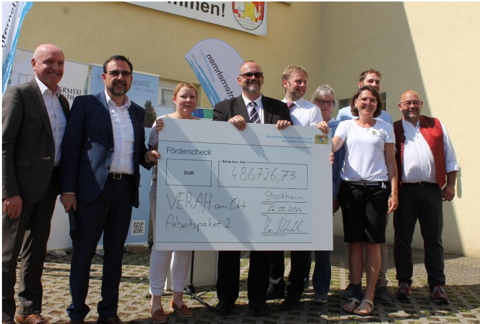
Abbildung 3: Überreichung des Förderschecks für das Versorg-Am-Ort-Projekt durch Herrn Staatsminister Holetschek bei der feierlichen Eröffnung des ersten Behandlungsraumes in Stockheim am 22.05.2023

22.05.2023: Feierliche Eröffnung des ersten VERSORGT-am-ORT-Raumes in Stockheim mit Besuch des damaligen bayerischen Gesundheitsministers Klaus Holetschek;